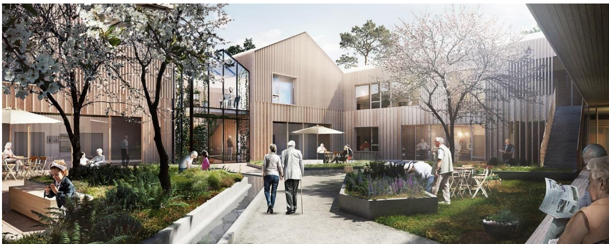
ILLUSTRASJON AV MORGENDAGENS OMSORG. FOTO: ARKITEMA ARCHITECTS

Frøya kommune gjennomførte i 2015 et prosjekt angående Morgendagens omsorg (MO). Prosjektet ser på en omlegging av pleie- og omsorgstjenestene på bakgrunn av den demografiske utviklingen vi vil få i årene fremover. Det er foretatt utredninger og vurderinger av satsningsområder innenfor sektoren. Disse ble vedtatt i kommunestyret februar 2016. Videre har direkte arbeid med prosjektet, nemlig etableringen av bygningsmassen for MO, startet opp, og er pr.d.d. pågående.