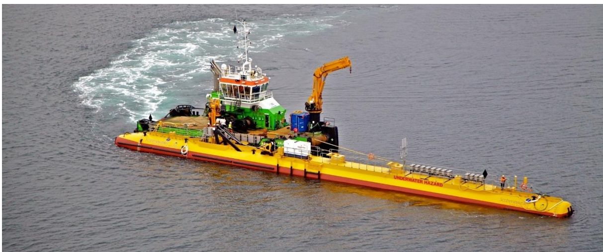
ORBITAL MARINEPOWER'S "ORBITAL 02" 2MW TIDEVANNSTURBIN.

Mye av årsaken til at Norge trakk seg ut av kappløpet er hvor kapitalintensiv innovasjon i dette markedet har vist seg å være. Likevel ser en nå flere lovende prototyper som blir testet ut ved Orknøyene i Skottland, både av flytende og bunnfaste tidevannsturbiner. Grunnen til at øysamfunn som Orknøyene har klart å etablere innovasjonsmiljøer for slike prosjekter, er naturgitte fordeler samt en godt etablert leverandørindustri, som opprinnelig var bygget for havbruk. Frøya, med sin bugnende havbruksnæring, naturgitte fordeler og kort vei til store kompetansesentre ( Blått kompetansesenter, NTNU, SINTEF og Ocean Space Centre ), ligger svært godt an til å kunne etablere seg som et norsk kraftsenter for utvikling, testing og operasjon av marine energianlegg, såfremt viljen for å satse er til stede.