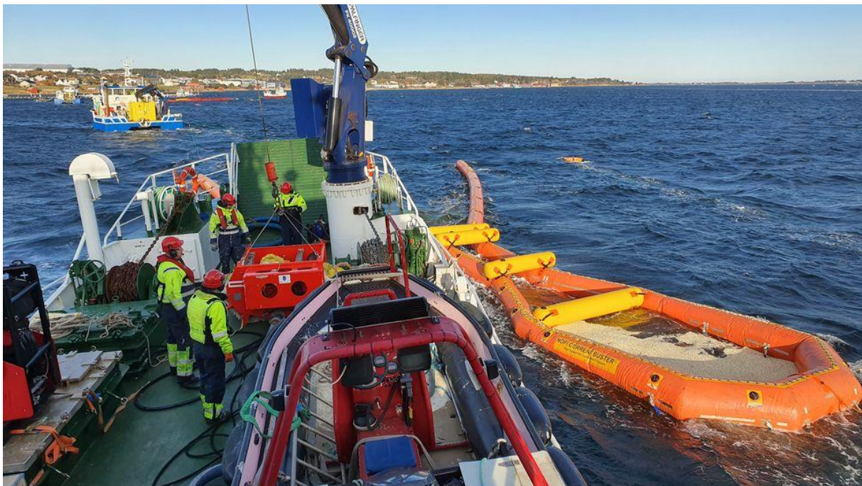
OPPSAMLING AV POPKORN UNDER ØVELSE FROHAVET.

I oktober 2019 ble «Øvelse Frohavet», den største oljevernøvelsen noen gang gjennomført i Norge. Øvelsen var en fullskala øvelse, med tre øvelsesområder i hhv. Brønnøysund, Tustna og på Frøya. Det hele ble koordinert fra Bergen og Stavanger, og aksjonsleder var Equinor, mens operasjonsledelsen kom fra Norsk Oljevernforening For Operatørselskap (NOFO). Det deltok 12 fartøy og ca. 600 personer på øvelsen. Det ble i tillegg sluppet 40 kubikkmeter med usaltet popkorn for å simulere oljeplakene.