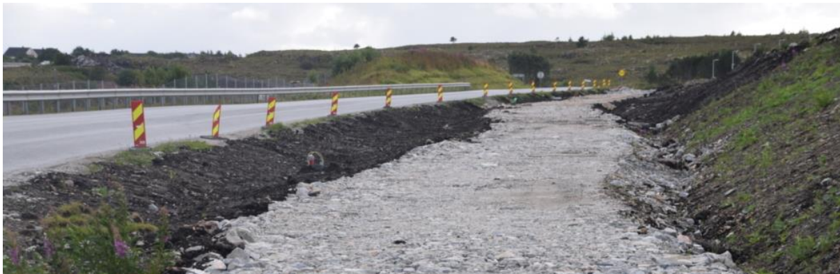
FIGUR 1: BYGGING AV GANG- OG SYKKELVEG HAMMARVIKA-SISTRANDA.

Videre er arbeidet med gang- og sykkelveg mellom Hammarvika og Sistranda kommet godt i gang, og det arbeides inn mot fylket for å kunne fortsette arbeidet med gang- og sykkelveg videre nordover mot Nesset. Dette er viktig arbeid for å redusere antallet ulykker, og Trøndelag har opplevd en markant reduksjon i antallet drepte og hardt skadde de siste årene.